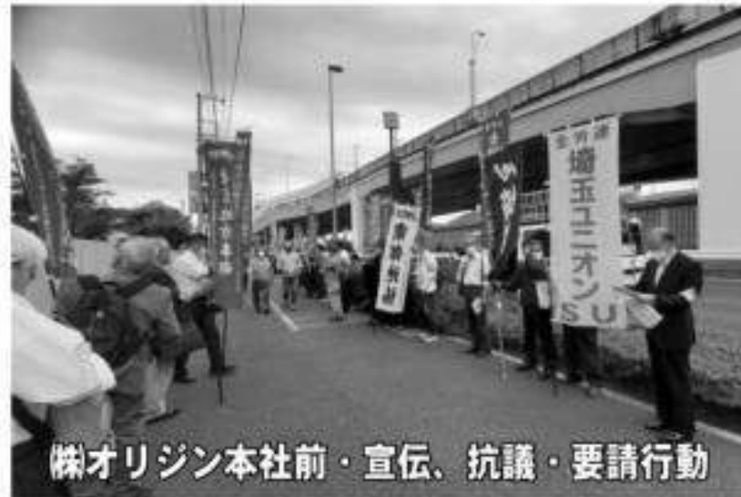
株オリジン本社前・宣伝、抗議・要請行動